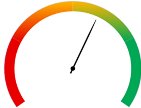
Exemple d'indice de préparation

Le troisième diagramme montre votre indice de préparation globale et vous donne des conseils pour l'améliorer.